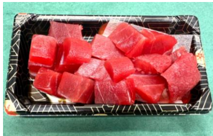
マグロぶつ切り 780円